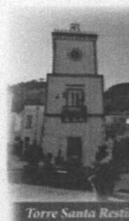
Torre Santa Restituta